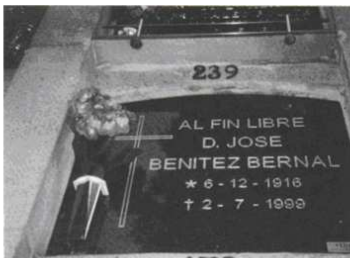
En «AB-BÃ», Cabo de Plata, siendo las 12.15 h. del 31 de enero de 2000.