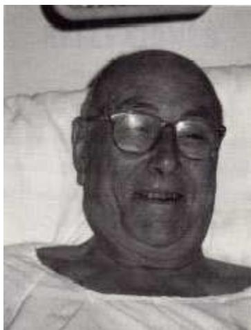
Mi padre, poco antes del sueño de la muerte